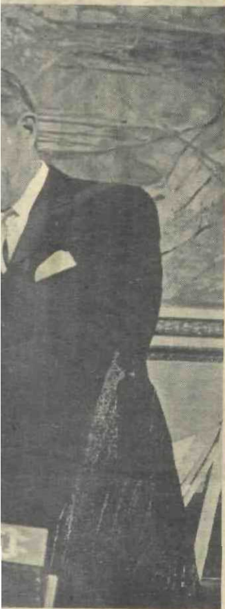
ør Gunnar Jahn (t.v.) over-

iten medlemmer av det diploma- iske korps.